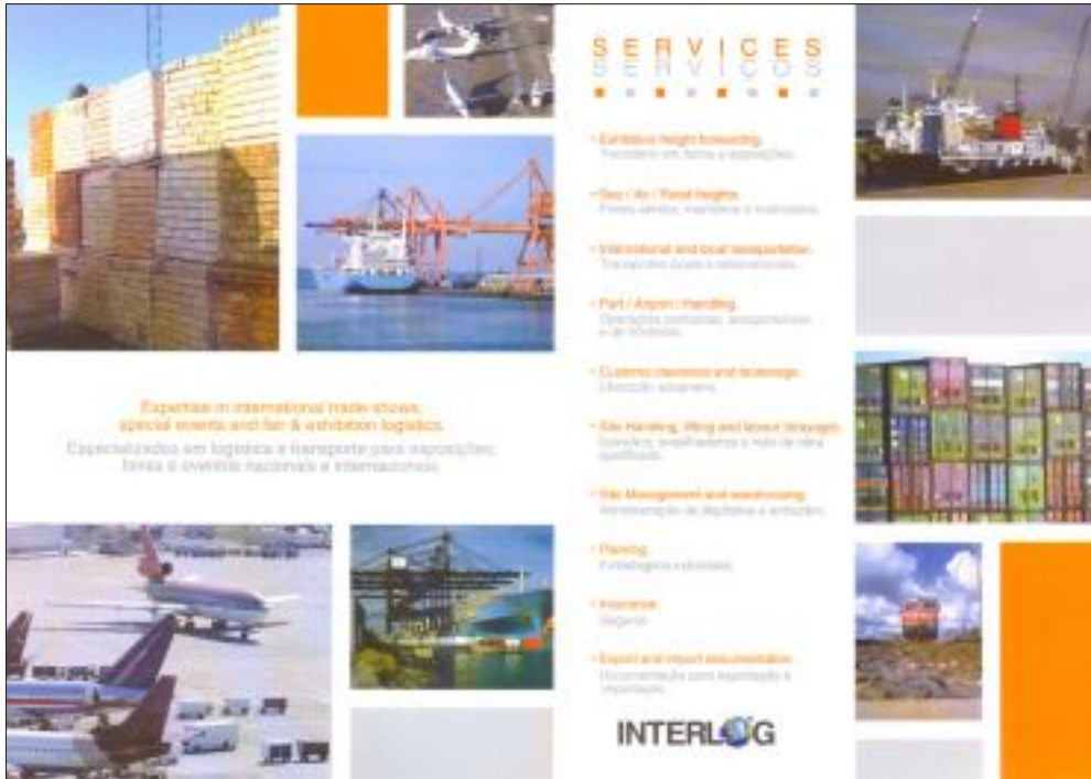
FOLDER A4 1 DOBRA • CLIENTE: INTERLOG